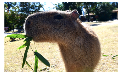
竹を食べるカピバラ